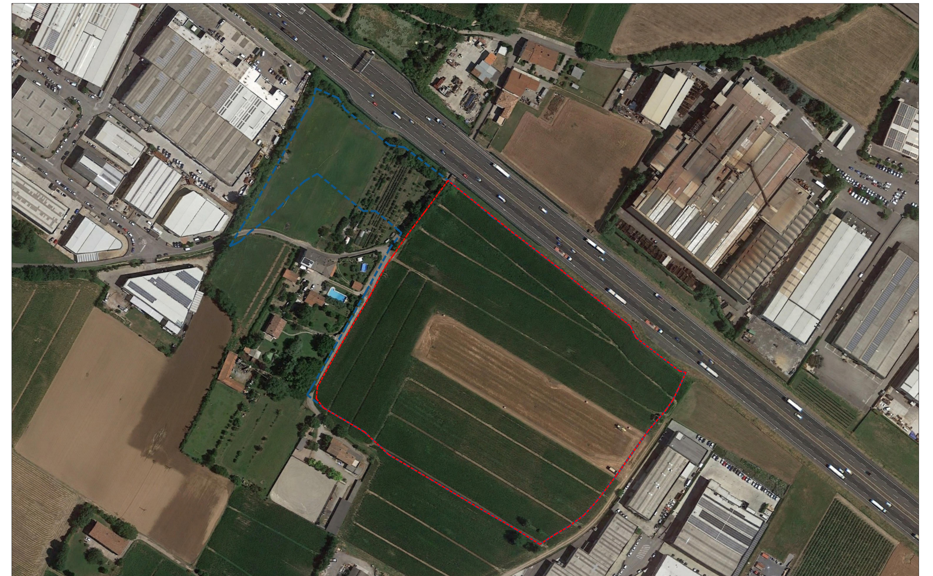
ORTOFOTO AEREA Scala 1:2000