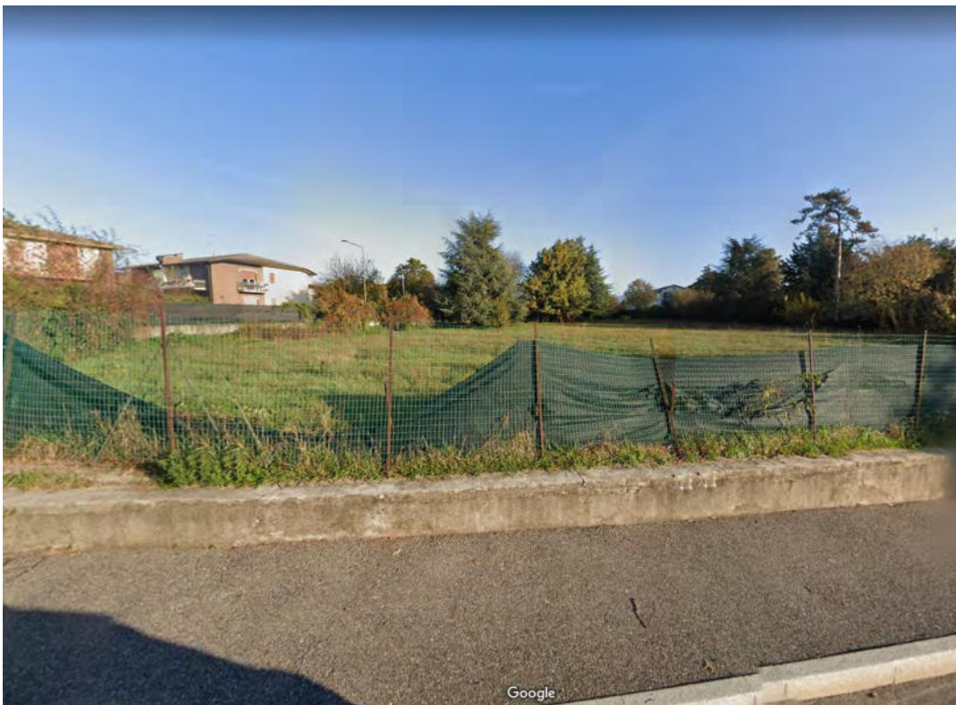
FOTOGRAFIA 9