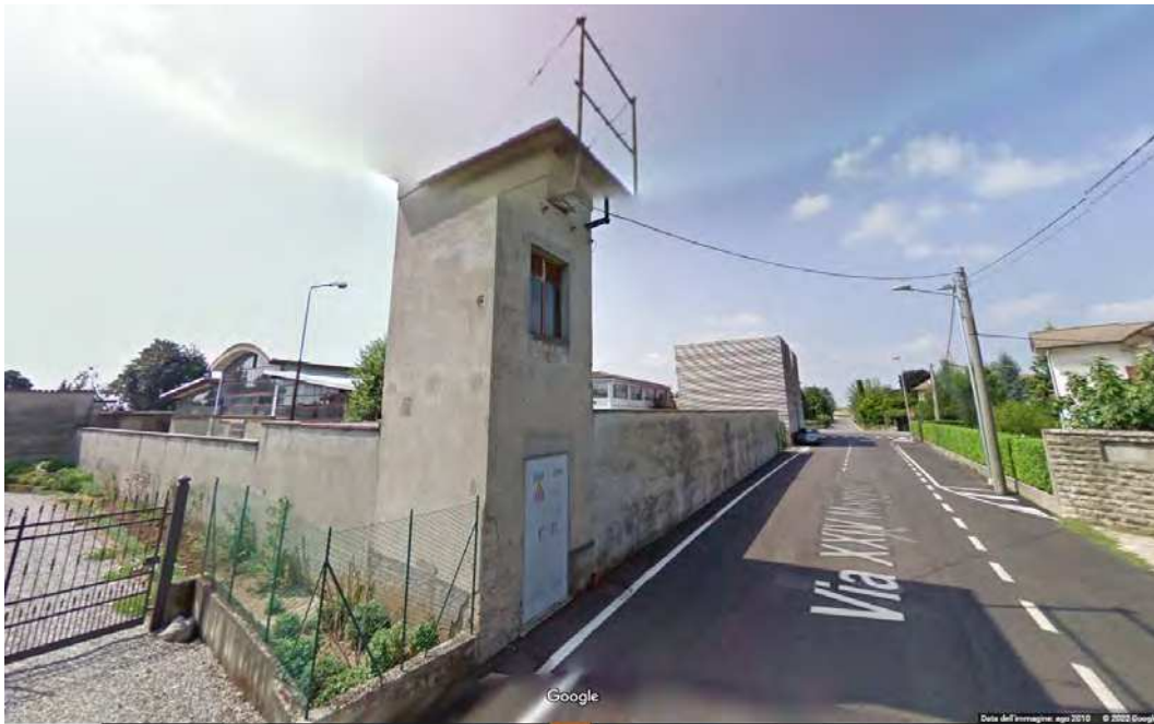
FOTOGRAFIA 11