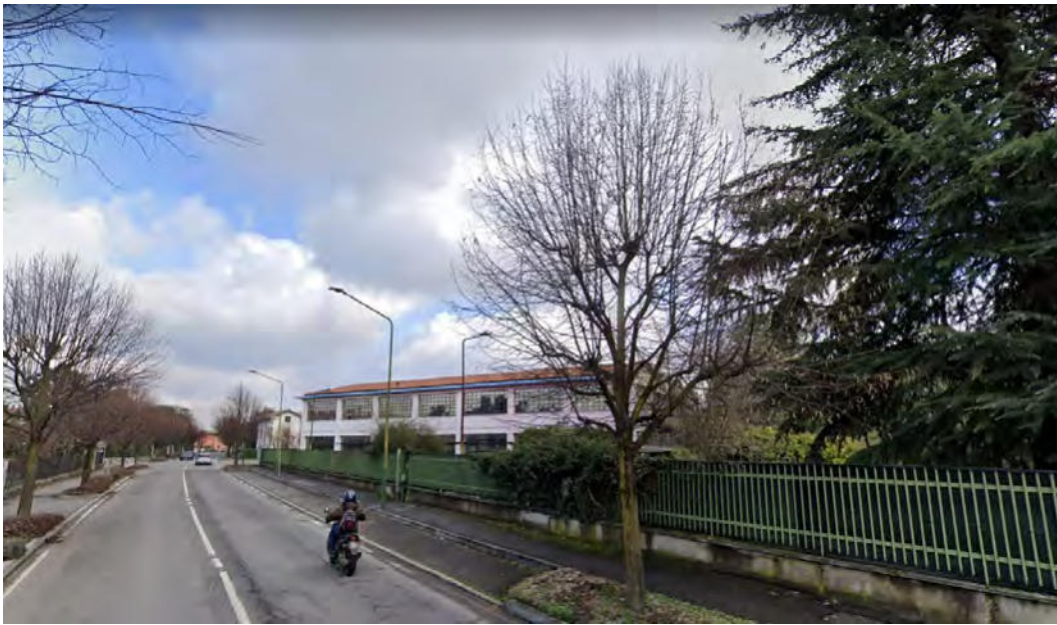
FOTOGRAFIA 10 (estratta da google maps)