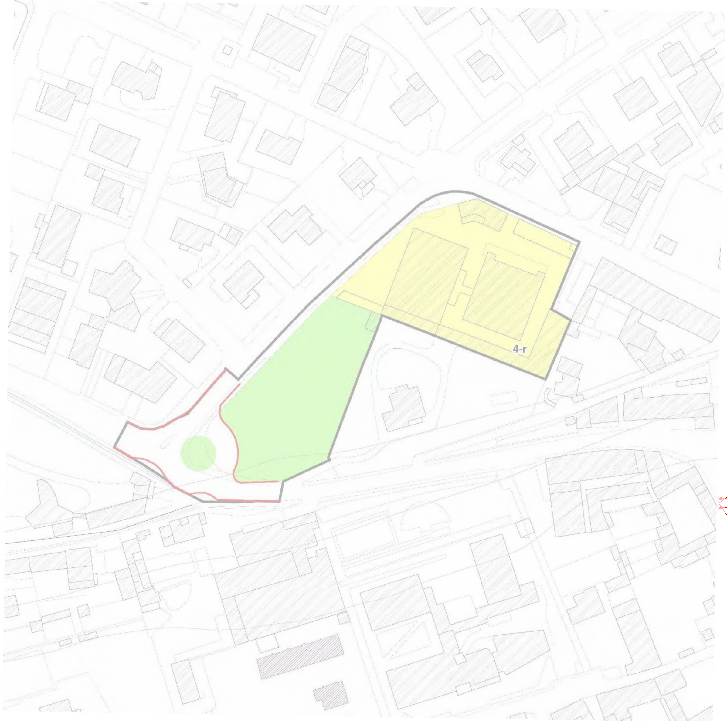
Piano di Governo del Territorio - Città di Palazzolo sull' Oglio