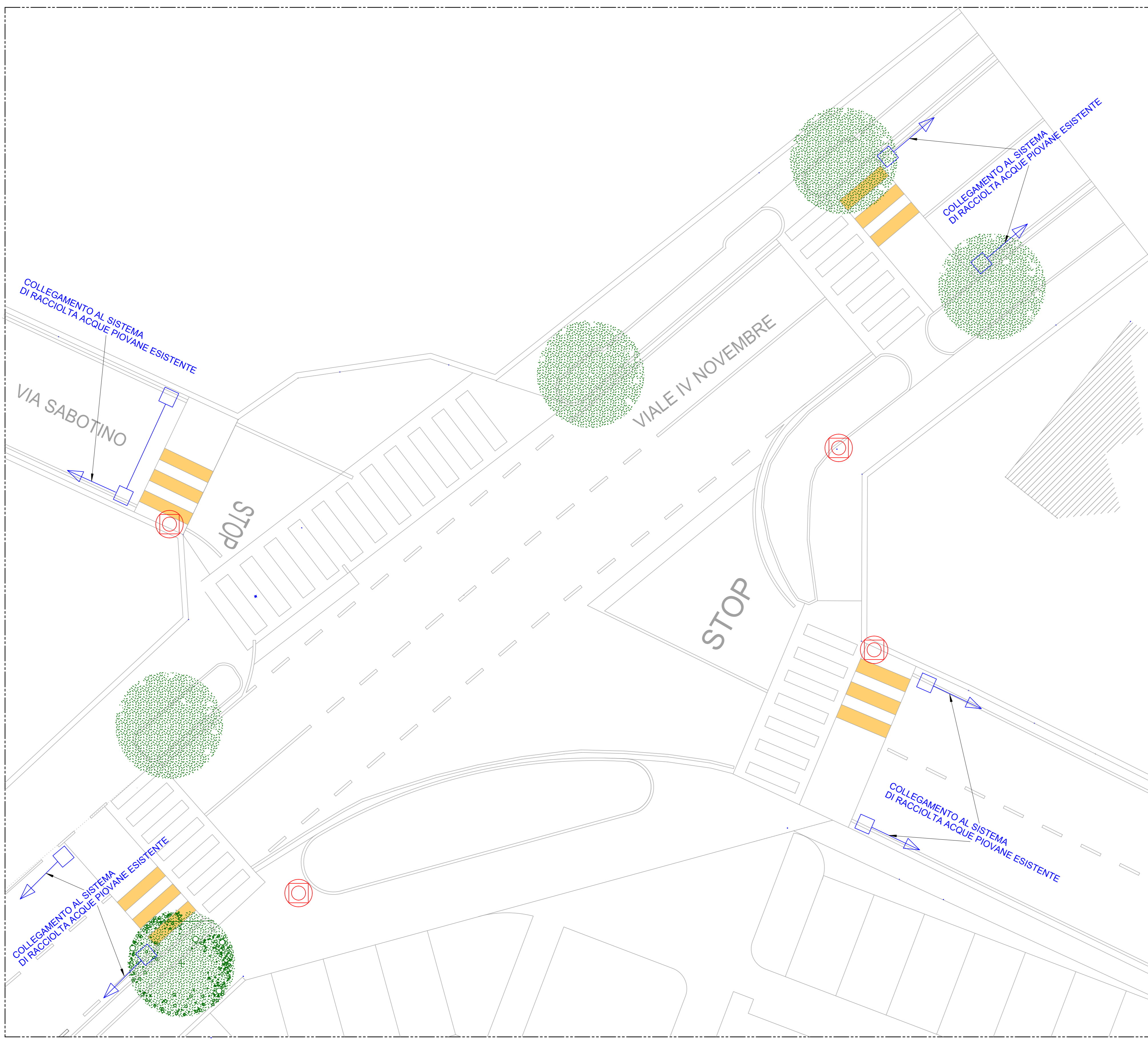
PIANTA DI PROGETTO INTERSEZIONE DA RIQUALIFICARE - IMPIANTI TECNOLOGICI - scala 1:100