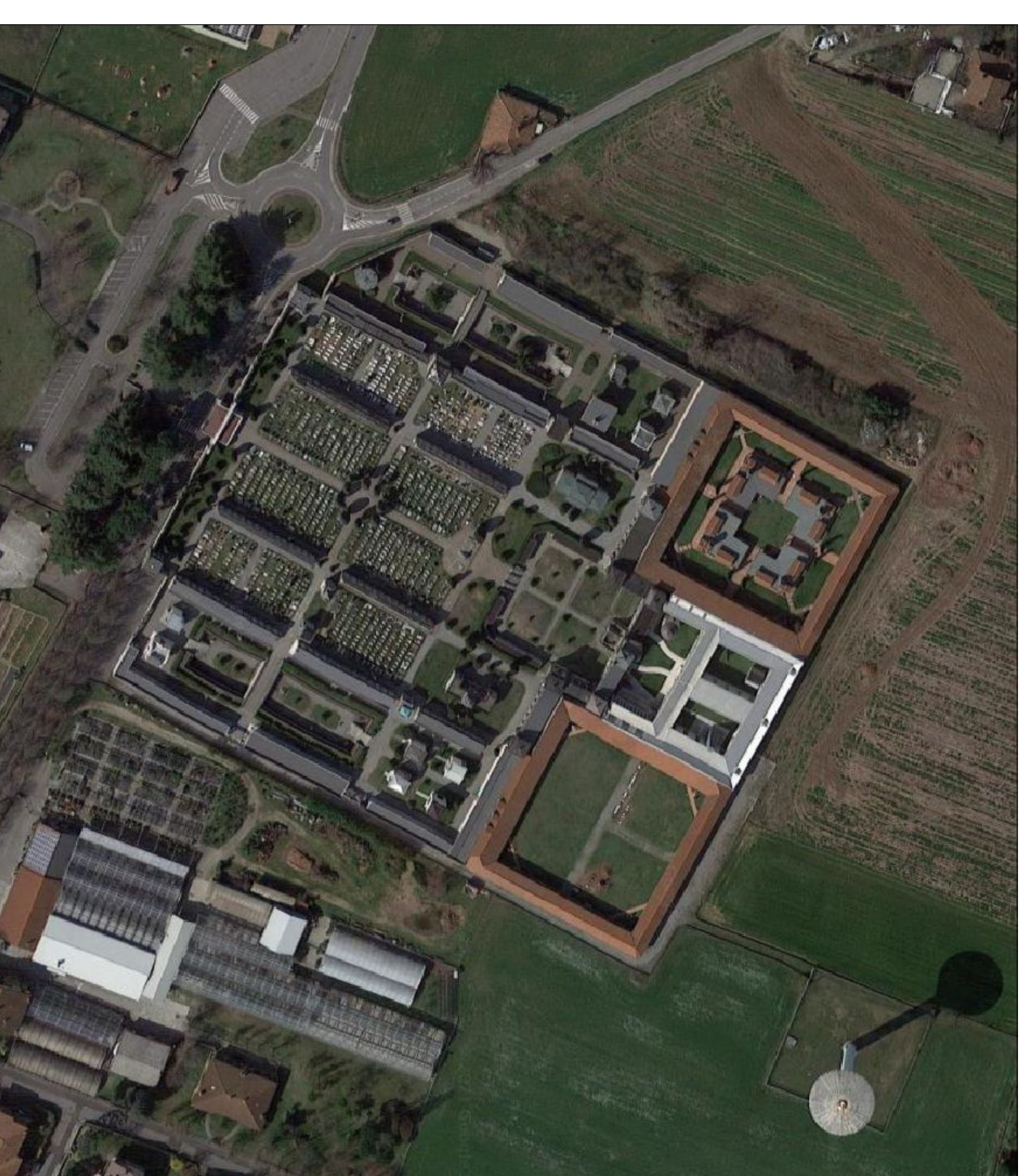
ORTOFOTO CIMITERO CAPOLLUGO