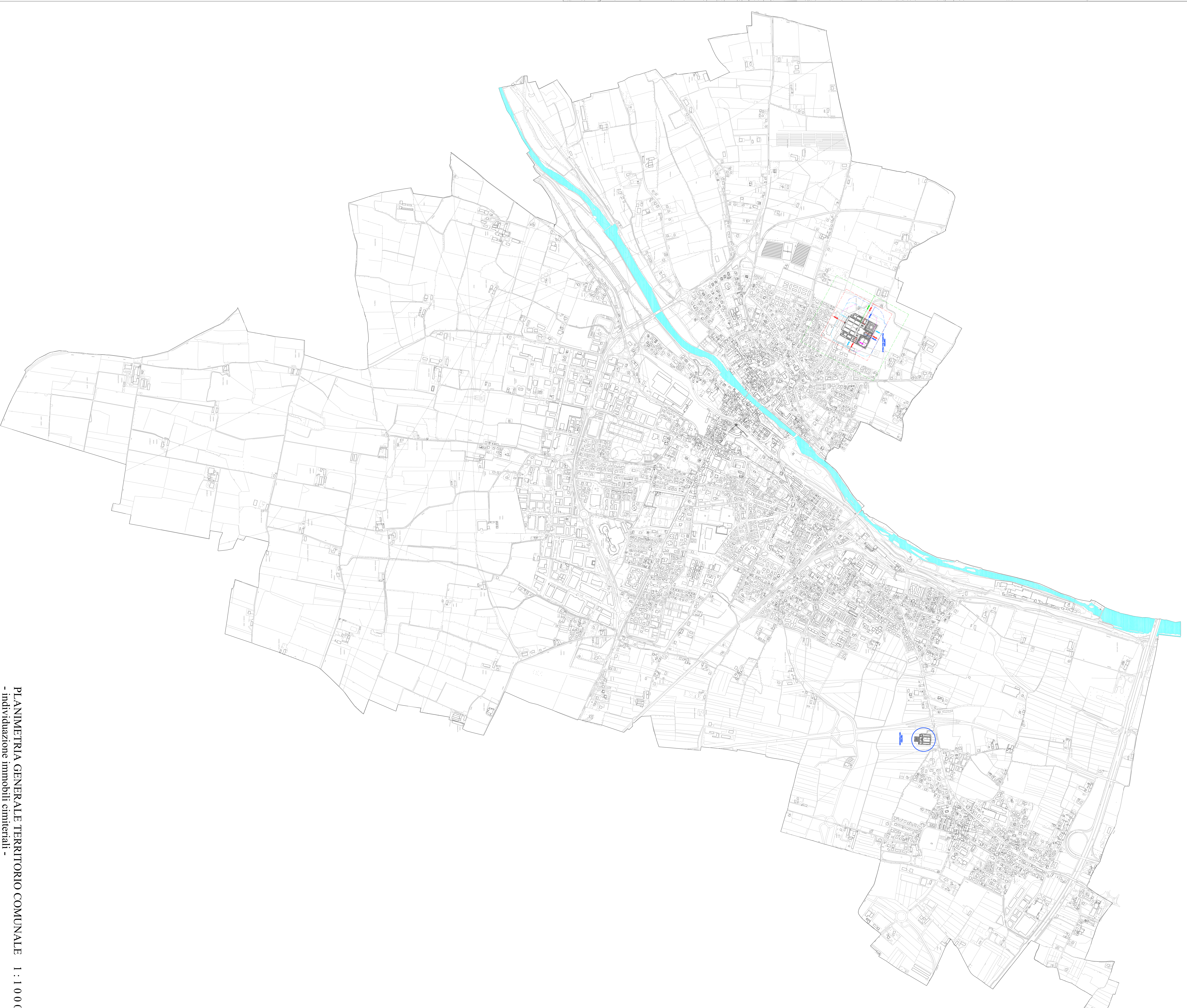
PLANIMETRIA GENERALE TERRITORIO COMUNALE 1 : 1 0 0 0 0 - individuazione immobili cimiteriali -