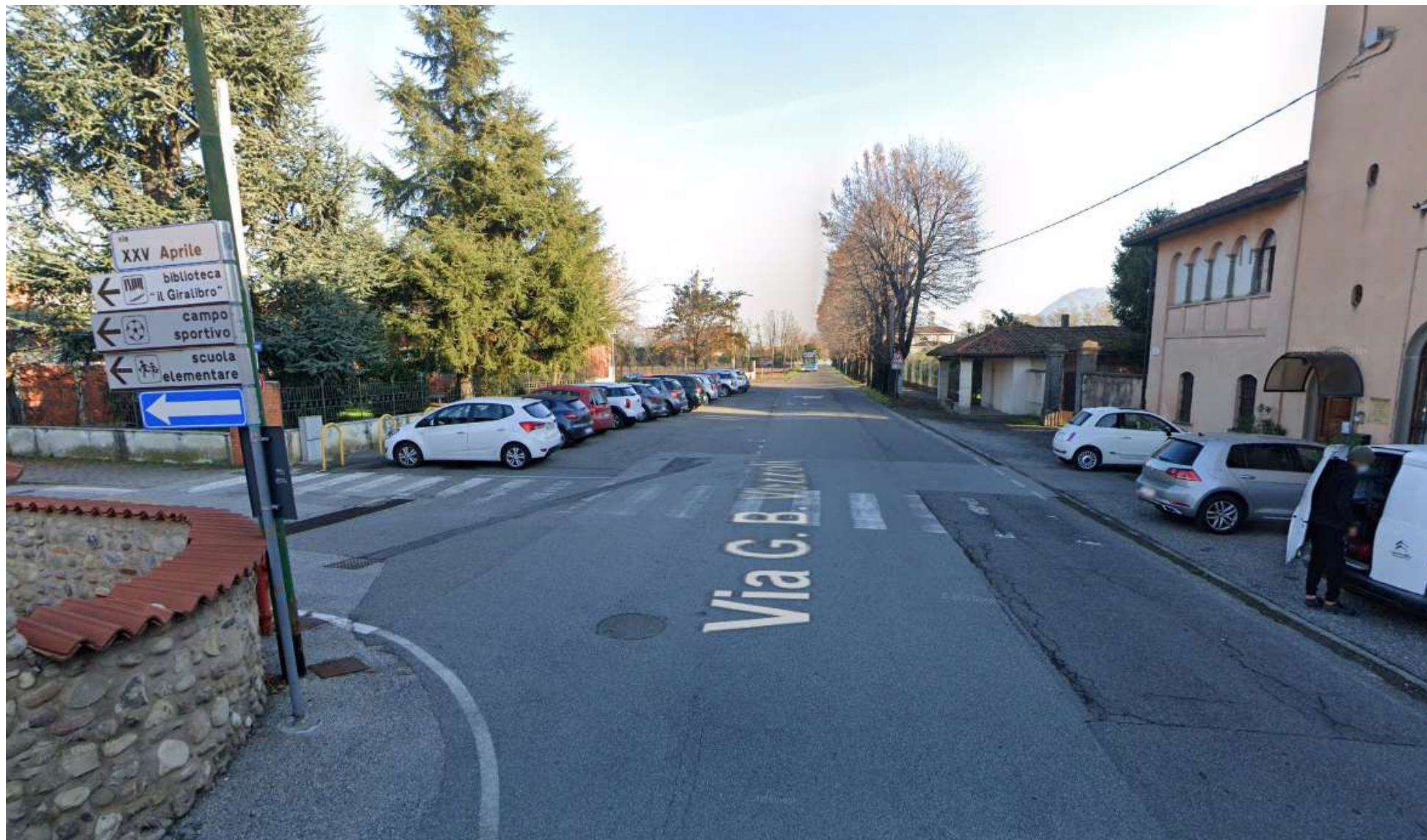
FOTO 03: via G. B. Vezzoli (ex SP 70) in corrispondenza dell'intersezione con via XXV Aprile