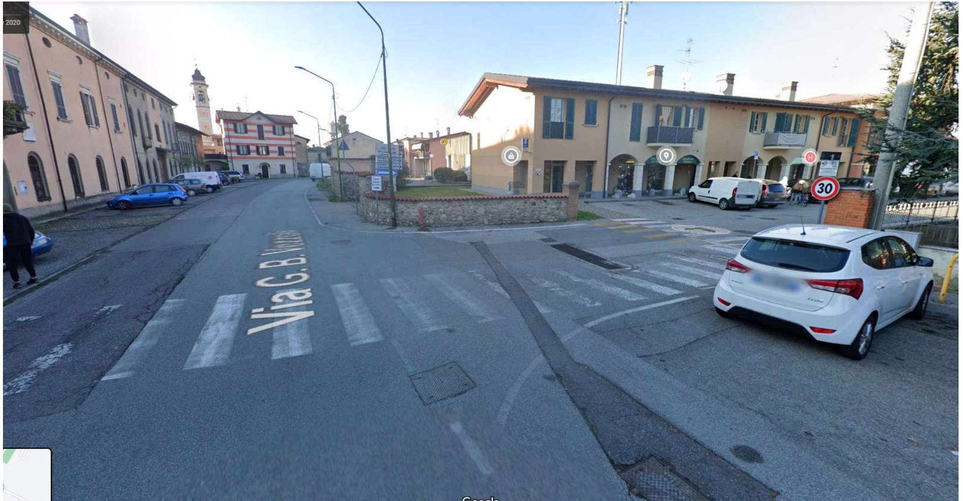
FOTO 02: via G. B. Vezzoli (ex SP 70) in corrispondenza dell'intersezione con via XXV Aprile