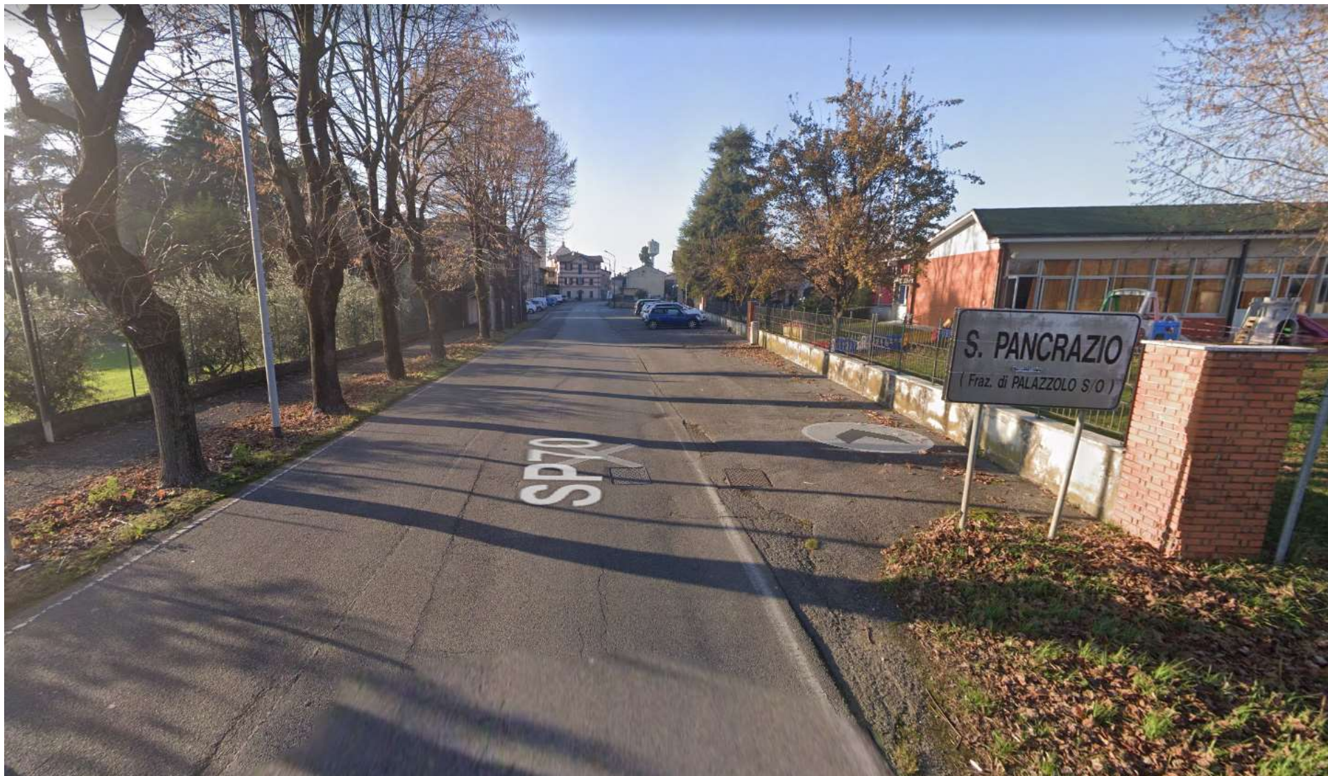
FOTO 01: via G. B. Vezzoli (ex SP 70) proveniente dall'extraurbano