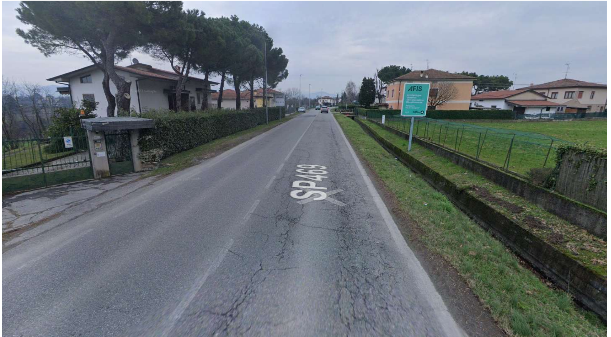
FOTO 03: via Pontoglio (ex SP 469) oggi priva di spazi dedicati all'utenza debole