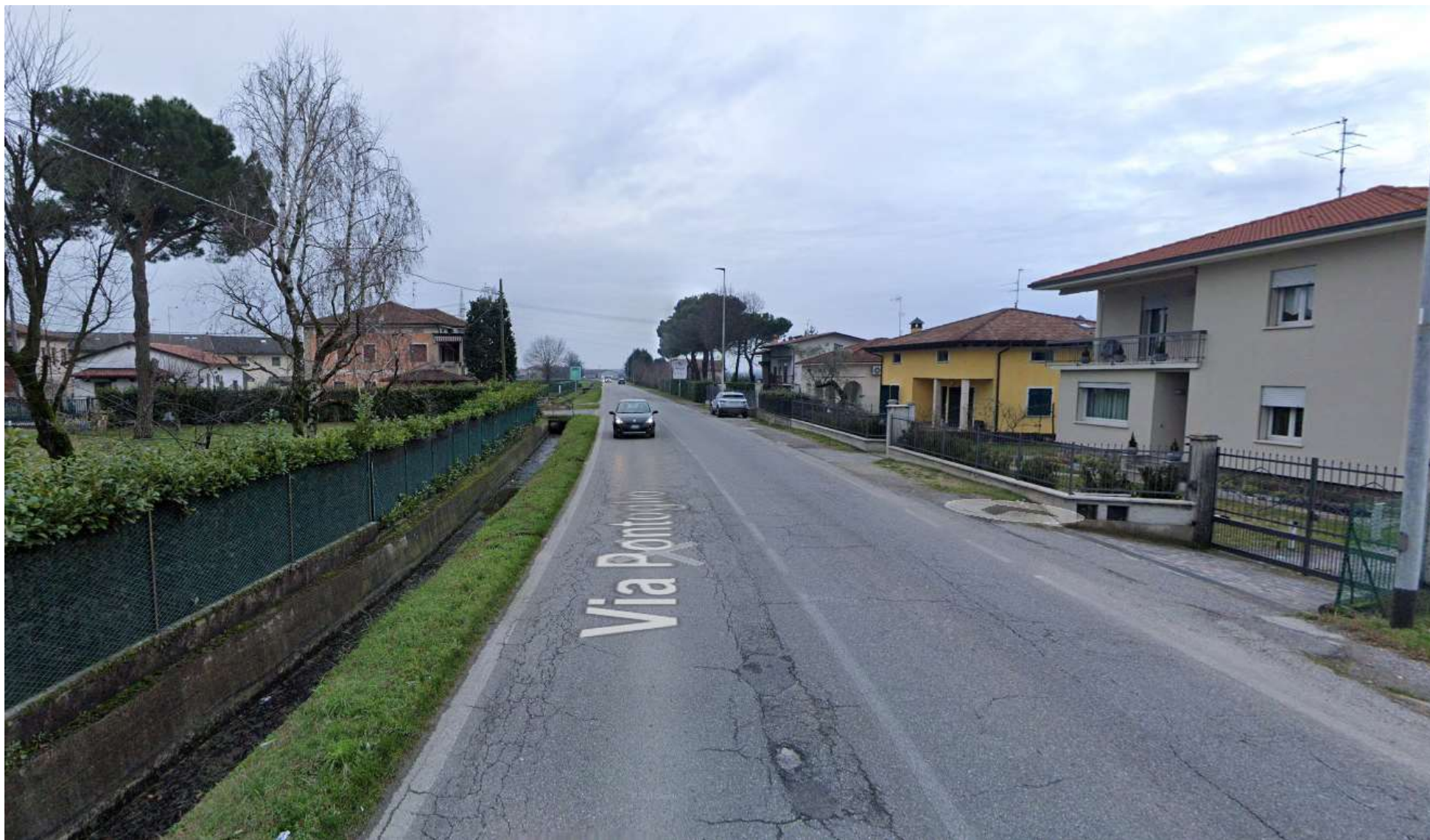
FOTO 02: via Pontoglio (ex SP 469) oggi priva di spazi dedicati all'utenza debole