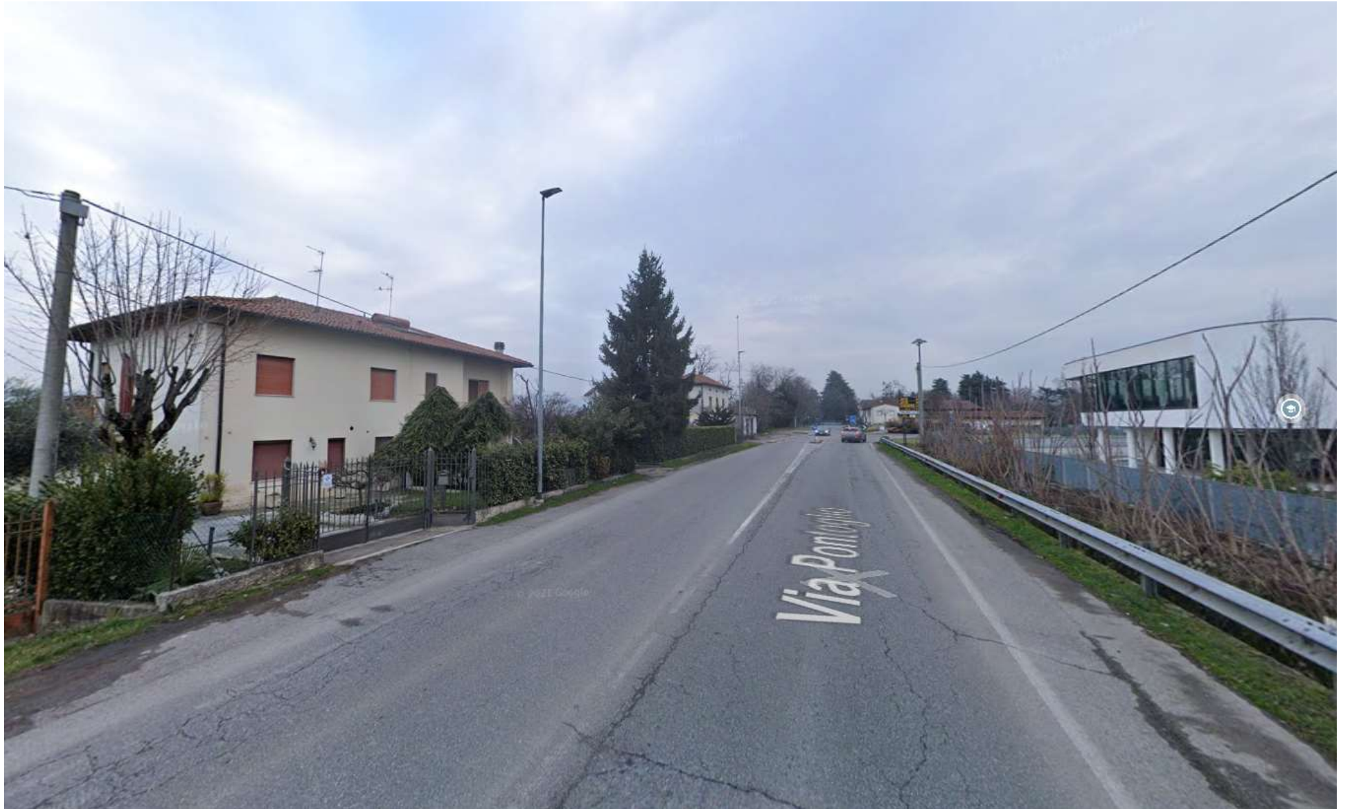
FOTO 01: via Pontoglio (ex SP 469) oggi priva di spazi dedicati all'utenza debole